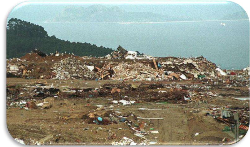
Vertedero de Vigo hoy (espacio regenerado)