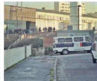
En aquella época, Guixar hubo muchos conflictos. BENITO

La planta empacadora de residuos sólidos instalada en el barrio de Guixar comenzó a funcionar el 3 de mayo de 1995 de forma intensiva, en medio de un largo enfrentamiento entre vecinos y las fuerzas de orden público. La Policía Nacional cargó en doce ocasiones con material antidisturbios, entre las tres y las cinco de la madrugada para controlar a los vecinos y permitir que se pudiese descargar la basura en las tolvas. A partir de las 0.30 horas, aproximadamente un centenar de personas de todas las edades se concentró en la avenida de Guixar.